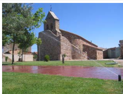
Estado actual de la iglesia de Pumarejo cuyo entorno ha sido ajardinado

M. A. C. La Consejería de Cultura de la Junta de Castilla y León ha iniciado el procedimiento para declarar la iglesia de Pumarejo de Tera como monumento de Bien de Interés Cultural (BIC). La Dirección General de Patrimonio Cultural ha considerado que el edificio religioso construido sobre el antiguo templo parroquial dedicado a Santiago Apóstol, bajo la dirección del arquitecto Miguel Fisac Serna y la colaboración de los vecinos, que aportaron la mano de obra durante algo más de dos años, es objeto de declaración BIC en la categoría de monumento.